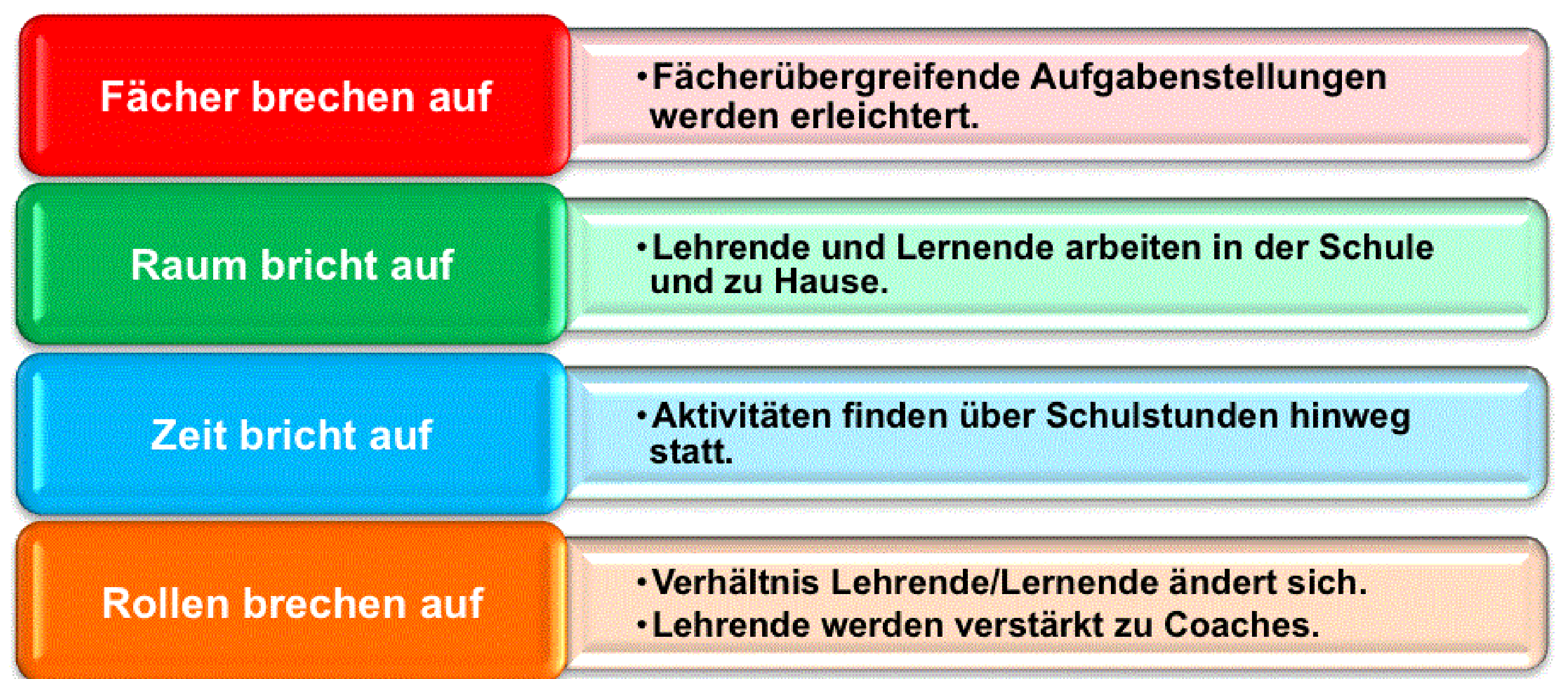
Abb. 3: Ergebnisse der E-Portfolio-Studie in Hinblick auf Unterrichtsplanung und Strukturen