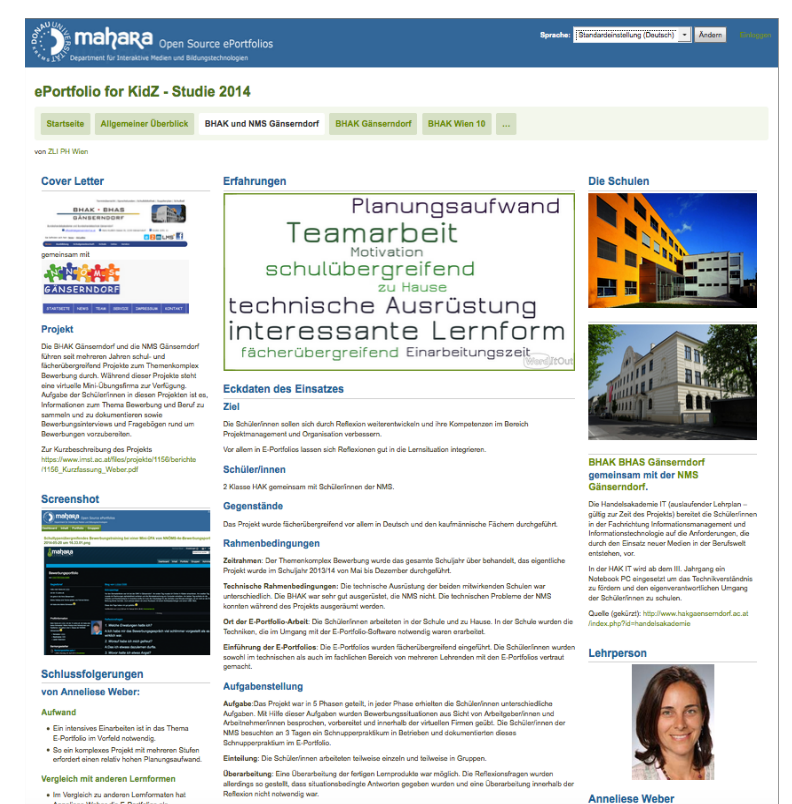
Abb. 4: Beispielsicht der BHAK und NMS Gänserndorf